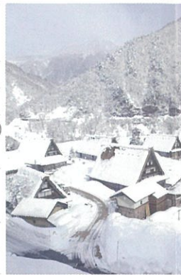
菅沼合掌造り集落