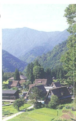
相倉合掌造り集落