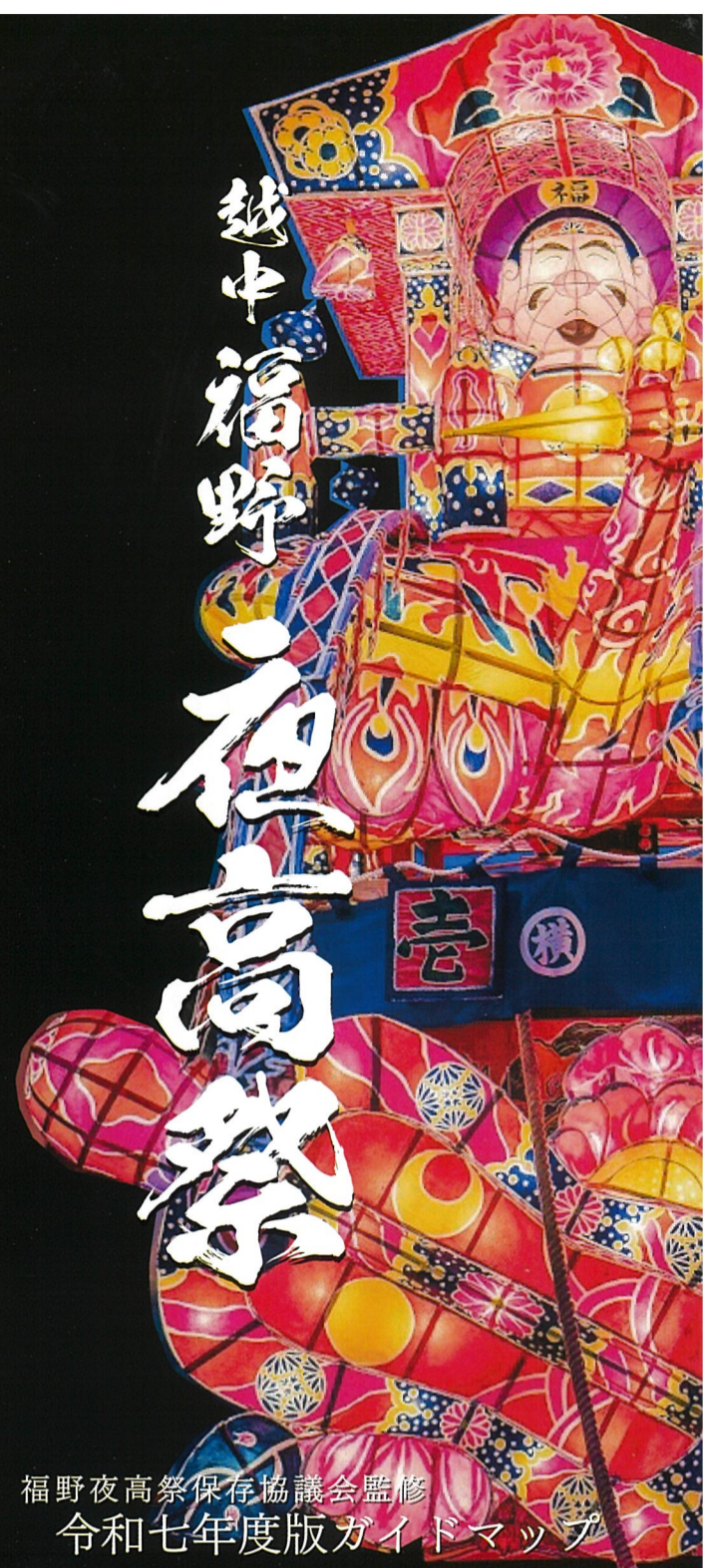
福野夜高祭保存協議会監修 令和七年度版ガイドマップ

企画・制作 Smile Factory ipppo http://smilefactoryippo.web.fc2.com/