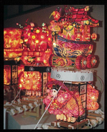
ミニ行燈 1/7スケール