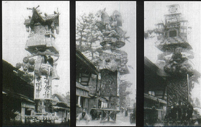
上の写真は明治時代の行燈です